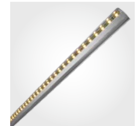
Position der Lichtleiste im Reflektor