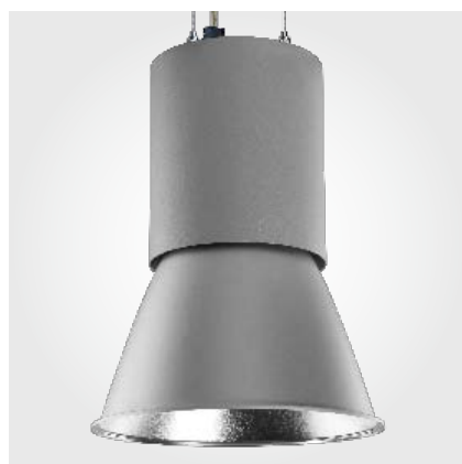
LED-Spot mit einem Ausstrahlwinkel von 30°.