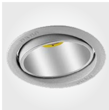
LED-Basic-Reflektor mit einem Ausstrahlwinkel von 40° oder 60°.