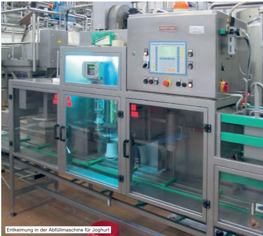
Entkeimung in der Abfüllmaschine für Joghurt